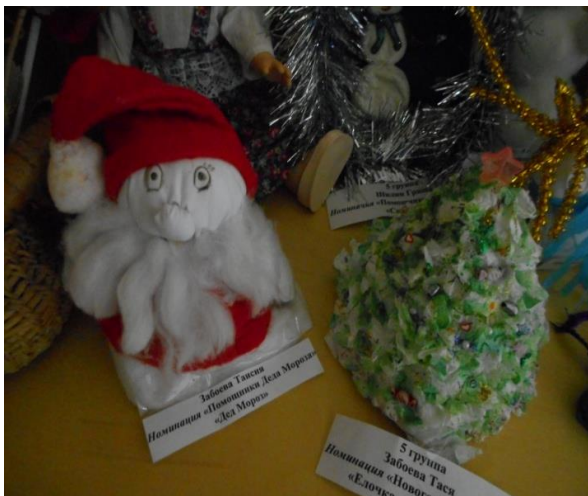
«Дед Мороз» семья Самохиных 5 гр. гр.№11 «Елочка» семья Забоевых 5 гр.