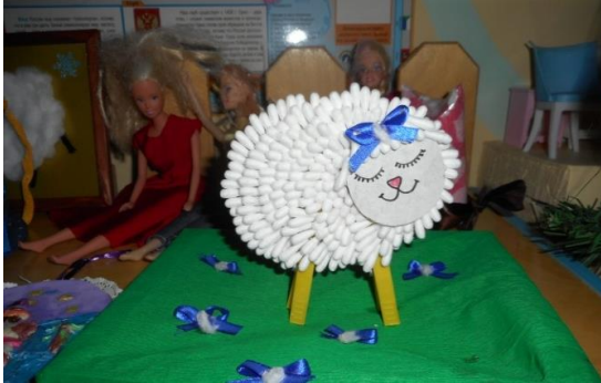
Семья Конаковых 5 группа