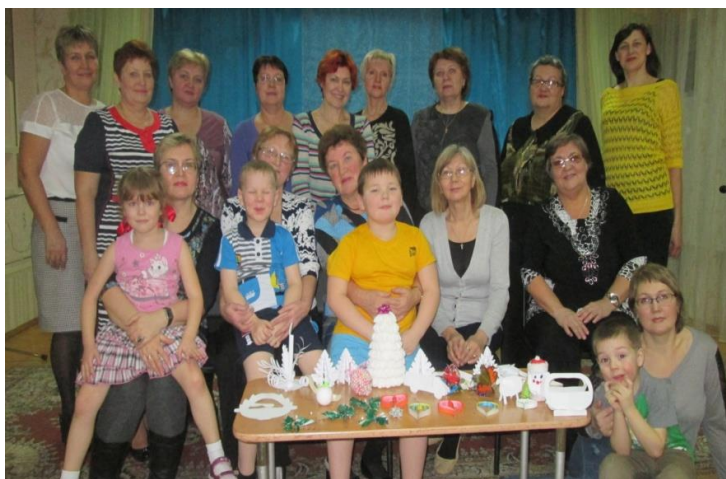
5. Участие в городском конкурсе «Новогодний калейдоскоп».