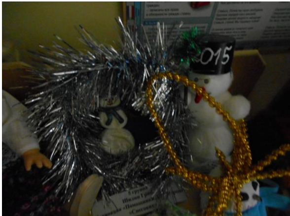
Семья Шилиных 5 группа