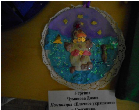
Семья Чумановых 5 группа